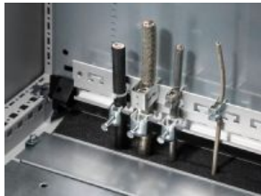
Schiene für EMV-Schirmbügel und Zugentlastung

Bitte beachten Sie auch folgende Alternativ-Produkte: