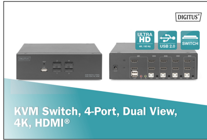
KVM Switch, 4-Port, Dual View, 4K, HDMI®